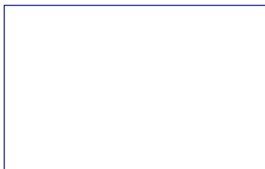
写真 3 使用風景 2